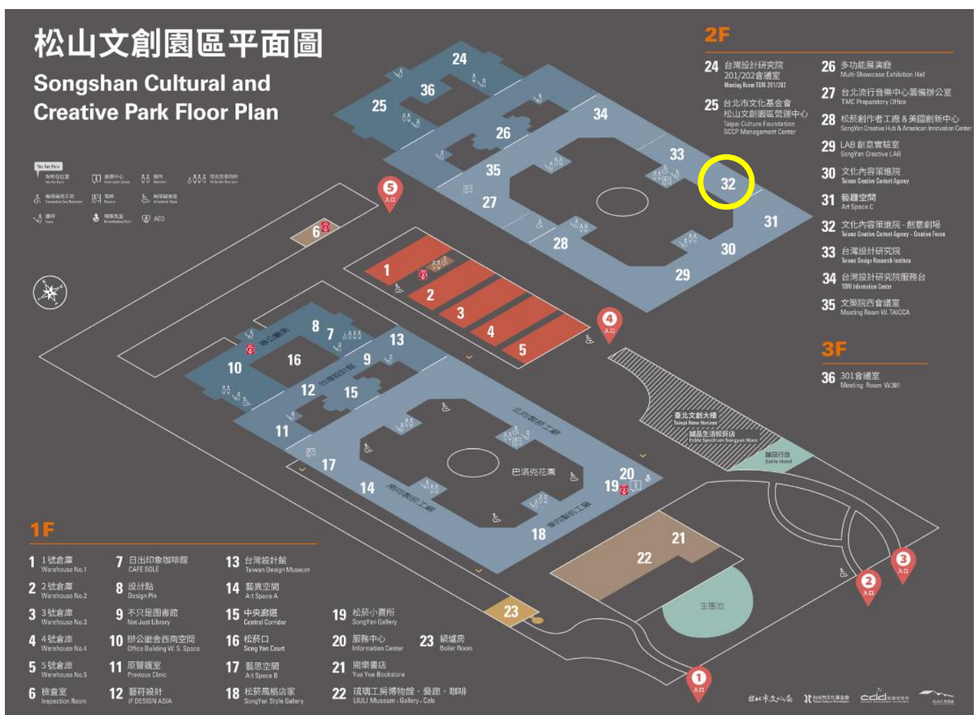
圖 4：32 號即為收件位置